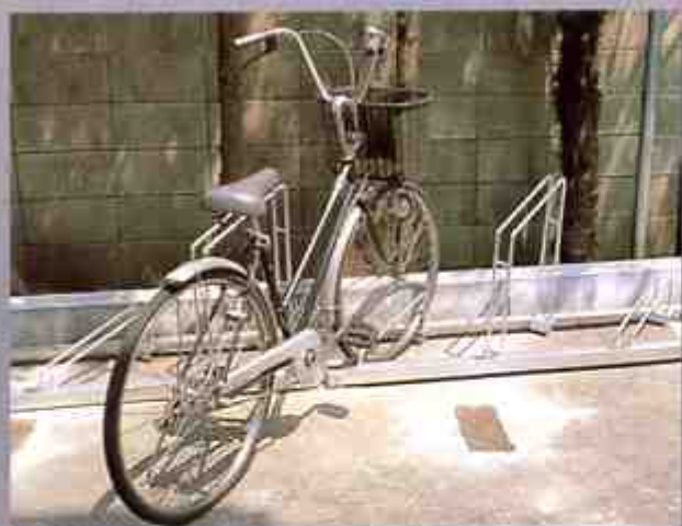
ホルダーラック (45°斜め)